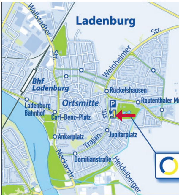
Galerie im Kreisarchiv des Rhein-Neckar-Kreises, Trajanstraße 66, Ladenburg